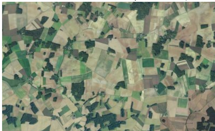
Photo2 : Autour de Montmirail dans la Marne

Mais qu'en est il en réalité ? Si l'on fait référence aux images aériennes ou satellitaires on constate que vu du ciel notre contrée n'est pas tout à fait le reflet de ce que l'on pourrait penser. Sur les deux images qui suivent il est évident que la forêt ou les petits bois n'occupent plus de manière équitable les sols avec l'agriculture. A noter qu'il semblerait que le département de la Marne soit bien plus respectueuse que l'Ile de France, mais à peu de choses à dire ! (photo 1 : La seine et Marne aux abords de Saint Barthélemy et Montolivet)